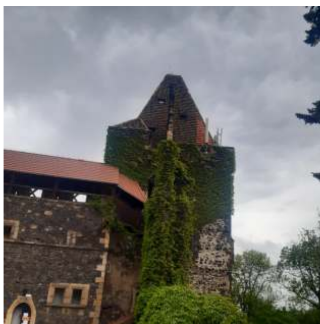
fot. Stara wieża Zamku Grodziec

- remont dachu starej wieży Zamku Grodziec. Na to zadanie spółka posiada również niezbędne dokumenty pozwalające na realizację tego przedsięwzięcia;