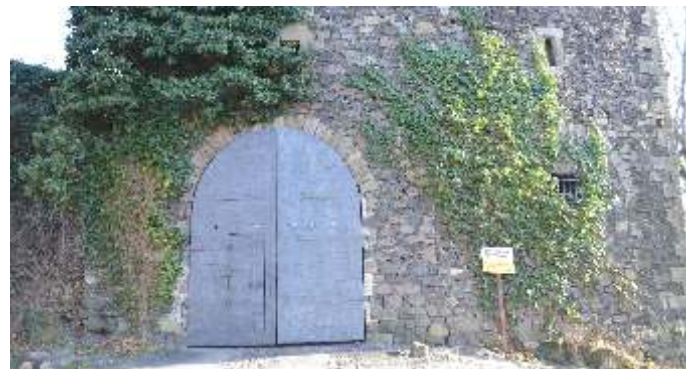
fot. Wrota bramy na podzamczu.

W roku 2019 Spółka Zamek Grodziec kontynuując powyższą inwestycję, w ramach II etapu zadania przeprowadziła prace zabezpieczające mur zamkowego lapidarium. W ramach tego działania wykonano odkrzaczenie i oczyszczenie terenu wokół muru lapidarium, wyrównano korony muru, naprawiono jego powierzchnię oraz przeprowadzono jego czyszczenie. Cały mur poddano precyzyjnemu, jednolitemu spoinowaniu.