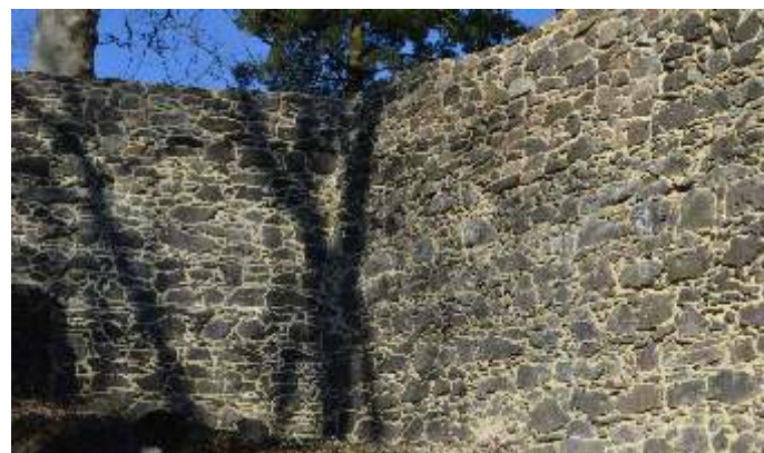
fot. Remont murów.