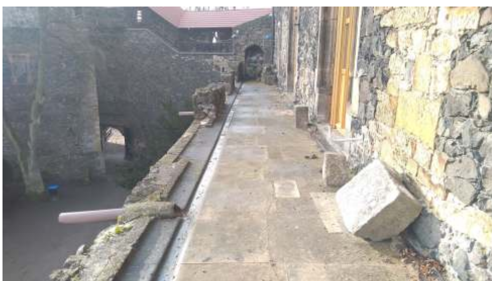
fot. Taras Zamku Grodziec.

- remont dachu starej wieży Zamku Grodziec. Na to zadanie spółka posiada również niezbędne dokumenty pozwalające na realizację tego przedsięwzięcia;