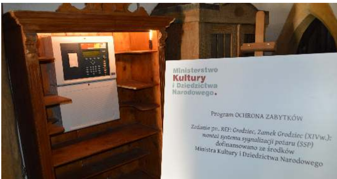
fot. Nowoczesna centrala ppoż. w zabytkowym meblu.

Wartość projektu wyniosła 64 000,00 zł, w tym dofinansowanie 40 000,00 zł.