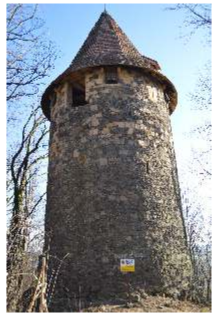
fot. Wieża wodna.

Na rok 2020, Zamek Grodziec Sp. z o.o. zaplanowała zadania remontowe, mające na celu zabezpieczenie obiektu przed dalszą jego degradacją, jak i poprawę bezpieczeństwa odwiedzających Zamek turystów.