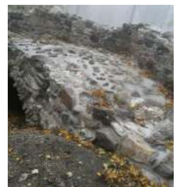
fot. Kazamata bastei południowej.