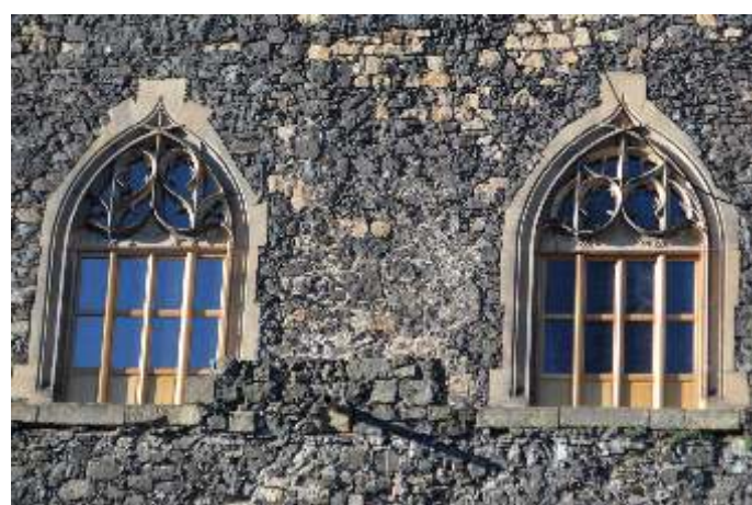
fot. Wymiana stolarki okiennej w górnej sali (Księżęcej).